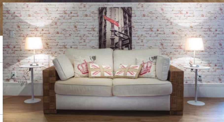
Sótão, inspirado nos descolados pubs londrinos.