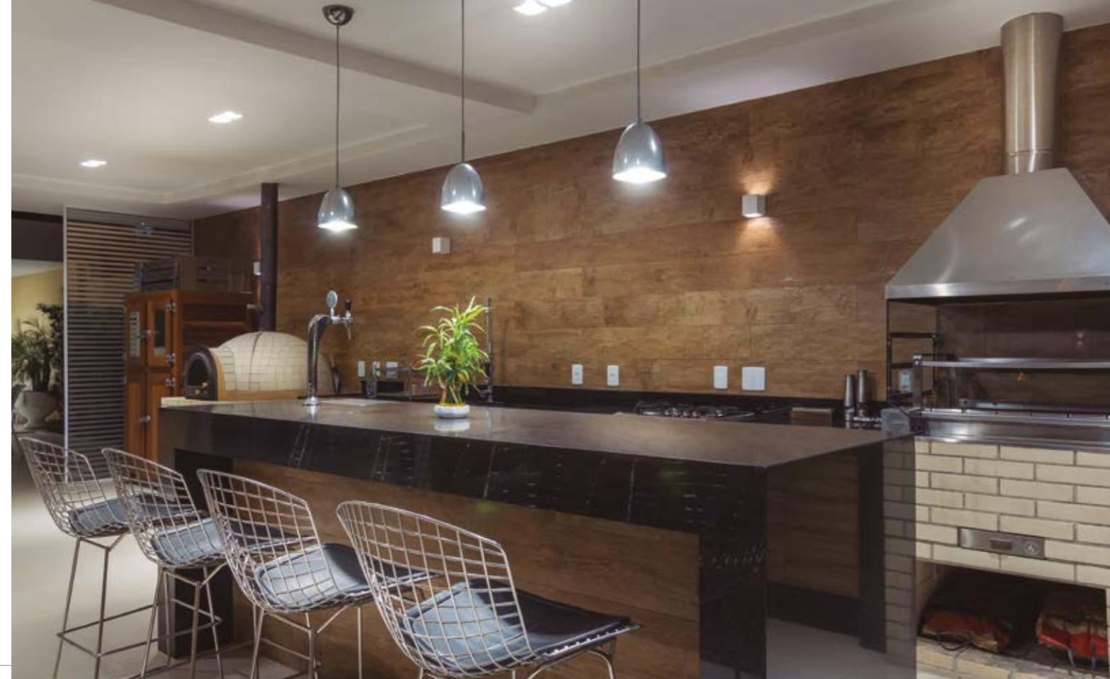
A designer criou uma espaçosa área externa, com materiais de fácil manutenção.

Os filhos do casal também ficaram muito satisfeitos. Isso porque, no sótão, localizado no terceiro andar da residência, a profissional projetou um espaço de entretenimento, com direito a jogos, pista de dança e bar. “O mais novo queria um local para expor sua coleção de camisetas oficiais de futebol. O filho mais velho, uma boa automação de som na casa. Ambos ainda desejavam um espaço para dançar, jogar e curtir com os amigos. Com tantos pedidos, aproveitei o enorme espaço do sótão para criar múltiplos ambientes”.